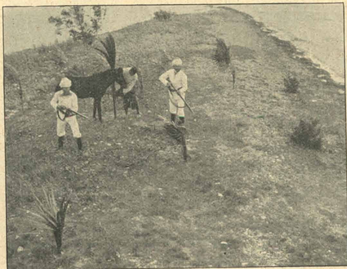
„Der Löwe kommt!“

I Filmens første Aar indskrænkede man sig af tekniske Grunde til Friluftsoptagelser. Men der er dog