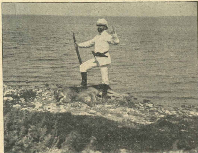
Fra „Løvejagten paa Elleore“.

blioteks Filmarkiv finder vi mange interessante Optagelser, som skyldes Hoffotograf Elfelt, bl. a. et Billede fra Bernstorff Slotstrappe, som Hoffotografen har optaget allerede i 1899, og paa hvilket man genkender Kong Christian IX († 1906), den russiske Kejser Nikolaj II († 1918), Kejserinde Dagmar, Dronning Alexandra († 1925), Prinsesse Marie († 1909) samt Prins Valdemar og hans Børn.